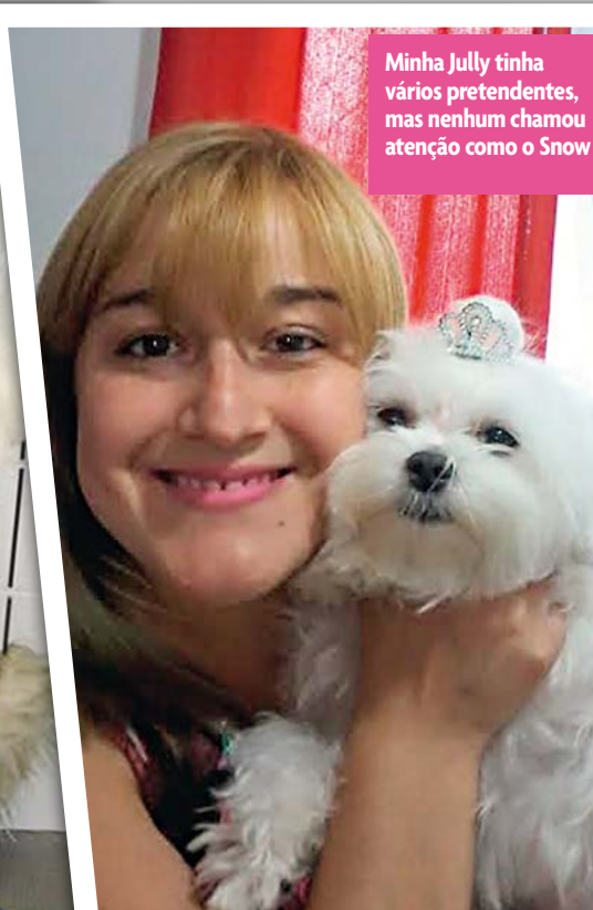
Minha July tinha vários pretendentes, mas nenhum chamou atenção como o Snow

Nome: Snow Sexo: Macho Raça: Maltês Cor: Branco